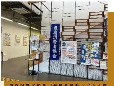
恵庭消費者協会「特殊詐欺防止パネル展」

えにあす内、市民活動センター1階のギャラリーコーナーでは市内で活動する団体・個人の作品などを展示してまいります。5～8月の展示をご紹介します！