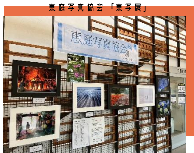
恵庭写真協会「恵写真」