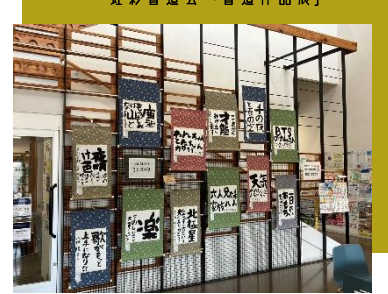
虹彩書道会「書道作品展」